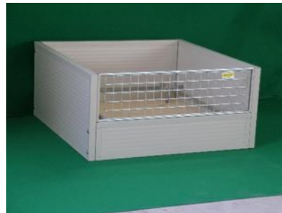
Caja de parto aislante

Estimado cliente, Gracias por comprar un producto FERRANTI.