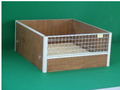
Caja de parto de madera